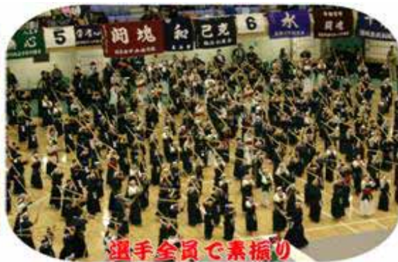
選手全員で素振り