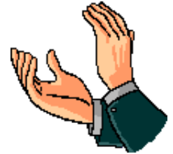
小学生代表 ちかいの言葉