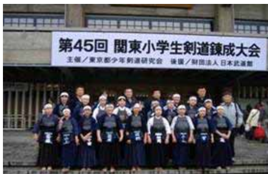
あこがれの日本武道館