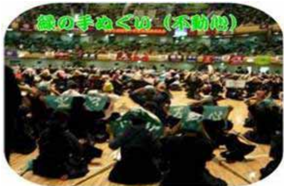
鐵の手ぬぐい (不動地)