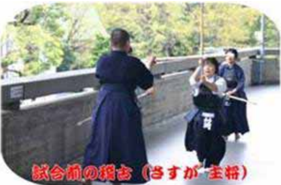
試合前の稽古 (さすが 主将)