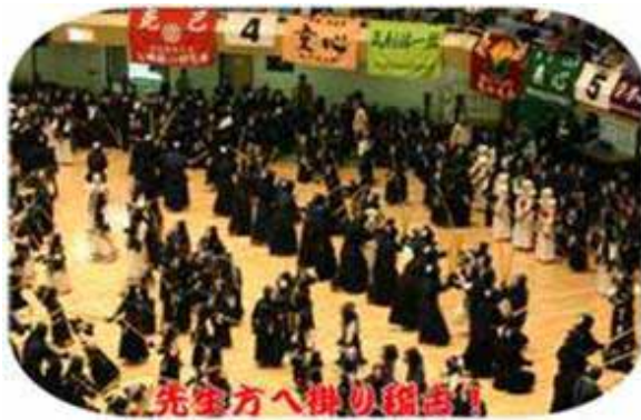
先生方へ掛り稽古